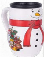
Relief-Schneemann Standard innen geeicht auf 0,2 l Material: Steingut Glaser: weiß / schwarz stapelbar: nein Art.-Nr.: 70-0090STD