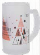
Ludwigsseidel geeicht auf 0,2 l Material: Glas satiniert stapelbar: nein 1. Art.-Nr.: LUDWIG02SAT-STD rw 2. Art.-Nr.: LUDWIG02SAT-STD sk