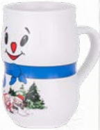
Iceman innen geeicht auf 0,2 l Material: Steingut Glaser: weiß stapelbar: nein Art.-Nr.: 7004