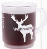
Glastasse satiniert 1-farbiger Druck geeicht auf 0,2 l Material: gehärtetes Glas stapelbar: ja Art.-Nr.: L2447SAT-STD