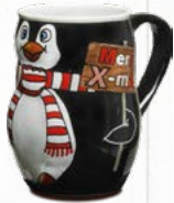
Pinguintasse innen geeicht auf 0,2 l Material: Steingut Glaser: schwarz / weiß stapelbar: nein Art.-Nr.: 72-9000STD