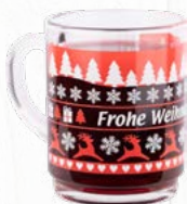
Glastasse Standard 2-farbiger Druck geeicht auf 0,2 l Material: gehärtetes Glas stapelbar: ja Art.-Nr.: L2447STD