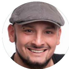
Jan Steinberg Senior Designer & Fotograf